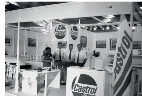
World Fishing Exhibition, stand de Enriel. Año 1983

Somos una empresa en constante crecimiento dirigida actualmente, por la segunda generación de la familia Barreiro, que continúa añadiendo hitos a esta historia con la firma del acuerdo con CASTROL, como Ambassador Castrol para la Península Ibérica de Marine & Energy , para mantener nuestro compromiso con las empresas relacionadas la sector marítimo, al que tan vinculados estamos desde nuestra fundación.