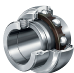
GE... (GRAE... G(N)E... Con Collar Excéntrico