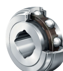
GVK(E)... Con agujero Cuadrado