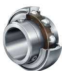
GAY... GYE... Con tornillos de de Fijación