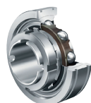
GE... GSH... G(N)E... Con manguito de Fijación