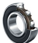
2... Fijación del Diámetro Interno