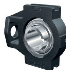
Soporte Tensor (Movimiento Lineal)