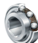
SK... Con agujero Hexagonal